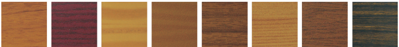
Eiche 4 Struktur